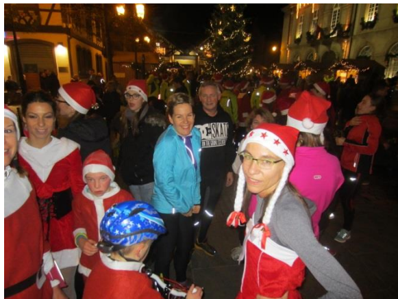
La course à pied en toute décontraction