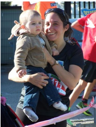
Mignon, la course à pied

Le pot des bénévoles F4P Halle au marché 19h