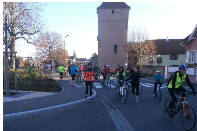
Un dimanche matin à l'entraînement